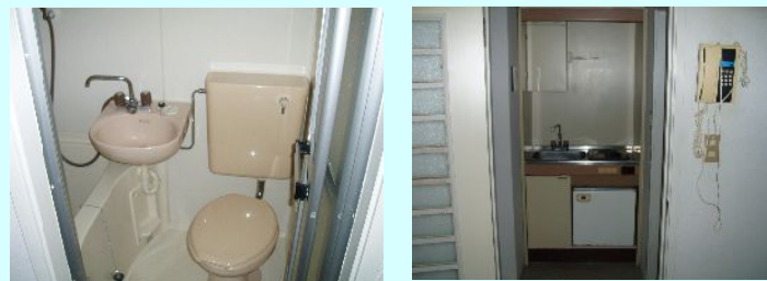
図面と相違する場合は現況を優先致します。